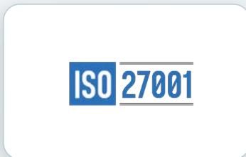
資訊安全管理 制度輔導