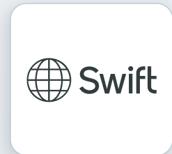
金融安全 認證輔導