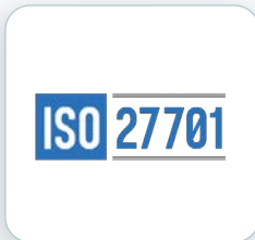
隱私資訊 管理輔導