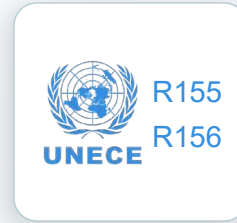
車聯網安全 認證輔導