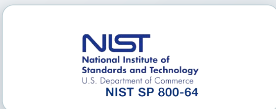
系統開發安全輔導