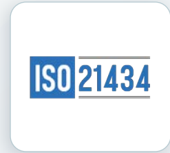
車聯網安全 認證輔導